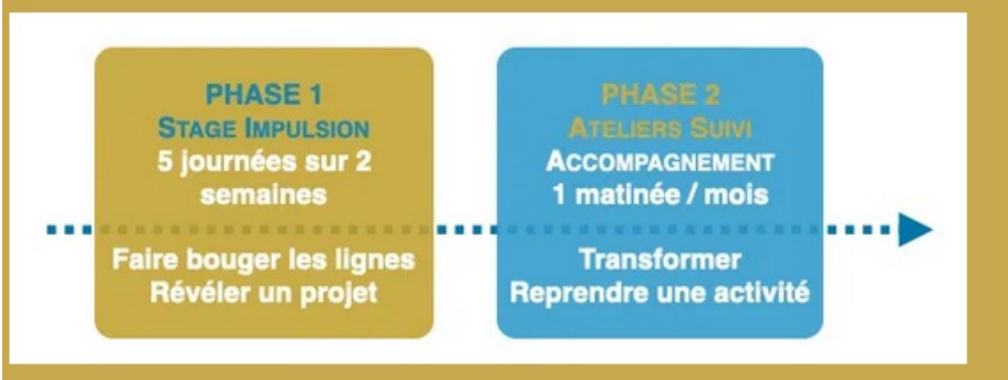
SCHÉMA TYPE D'UNE SESSION COLLECTIVE POUR 10 BÉNÉFICIAIRES

Le dispositif est gratuit sur conditions d'éligibilité validée par formulaire de candidature [1]. Le nombre de places dépend du département de résidence. Les dates de démarrage seront communiquées après validation de la candidature.